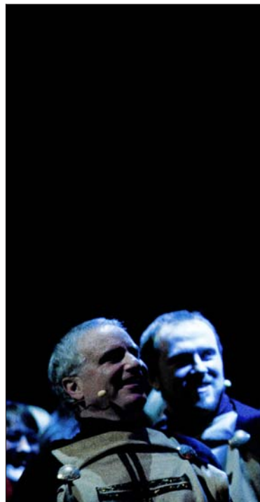
Bodil Buonaventsens kostumer er med til at lyse op og fastholde den positive stemning.

der er vokset en hel rejseindustri op omkring dette at arrangere "pilgrimsture" til Assisi.